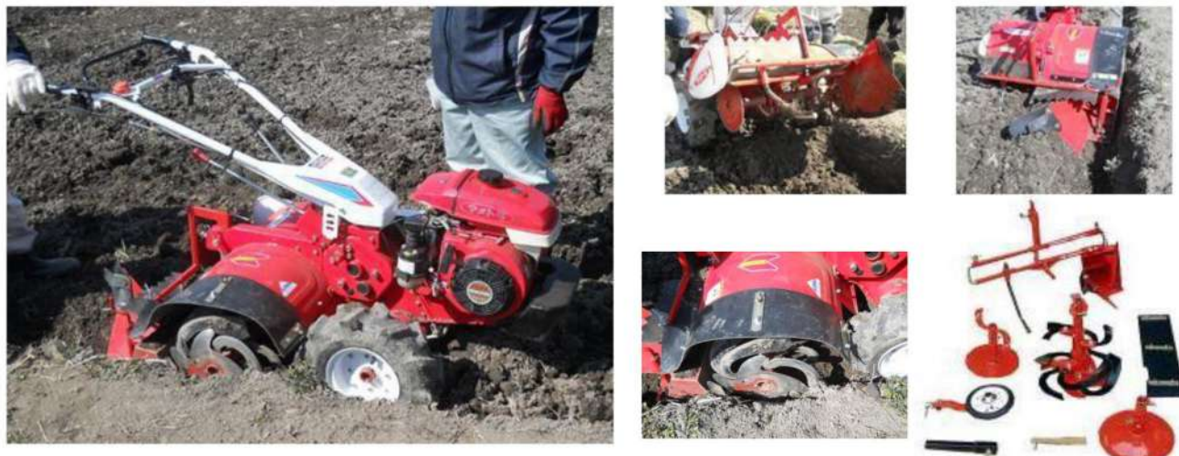
スーパーあぜ切りセット