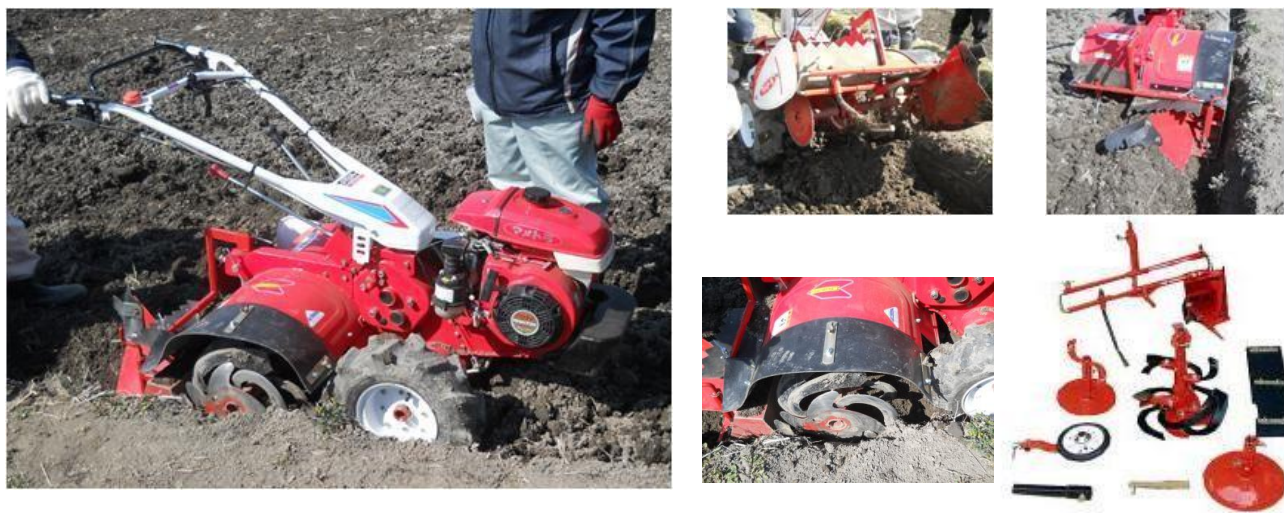
スーパーあぜ切りセット