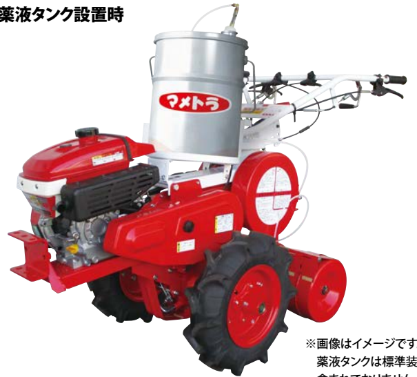
薬液タンク設置時