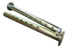
C27-0507-000 ボルト 9BT-4004-003 パネ座金 9SW-4004-003