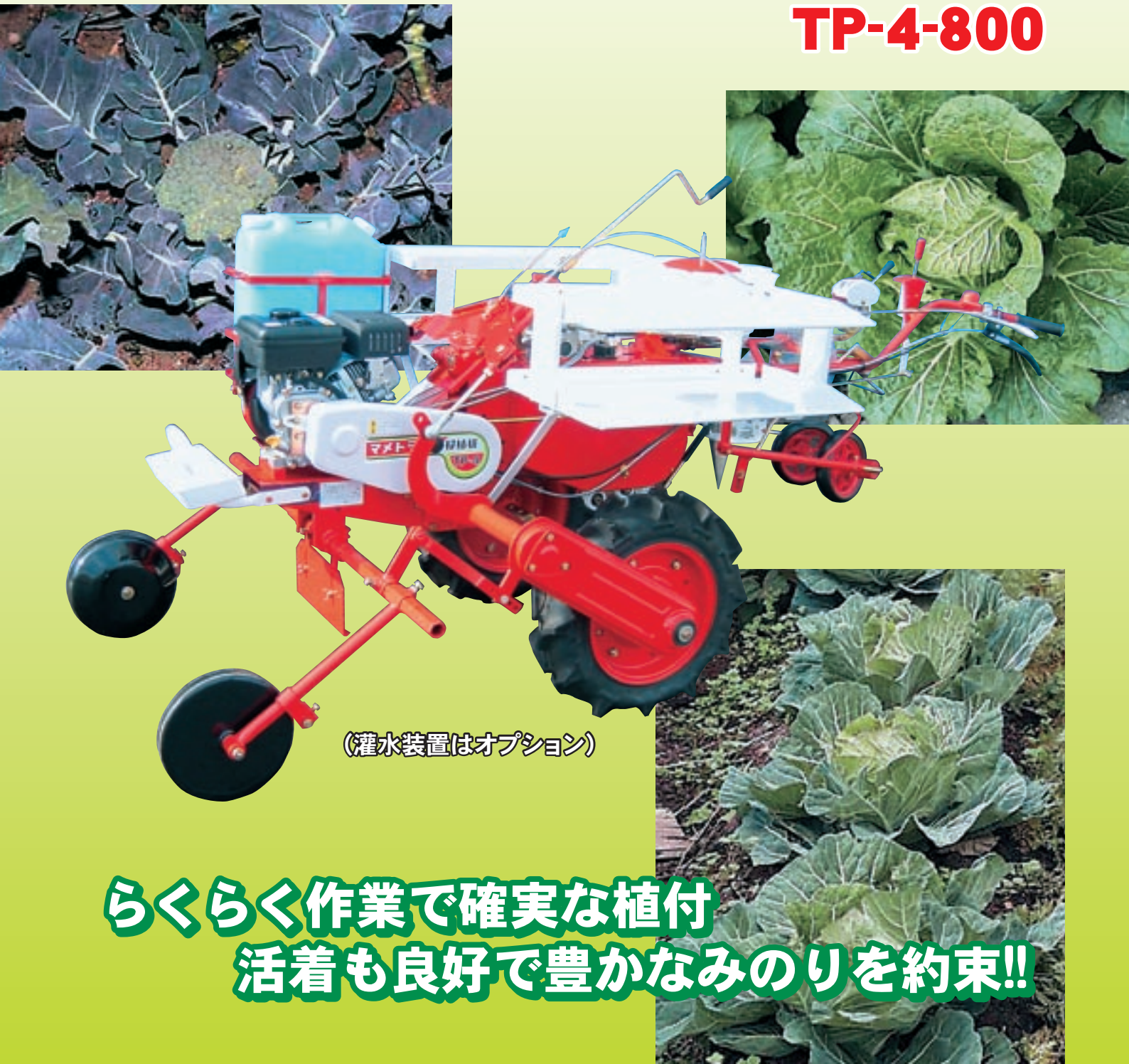
(灌水装置はオプション)