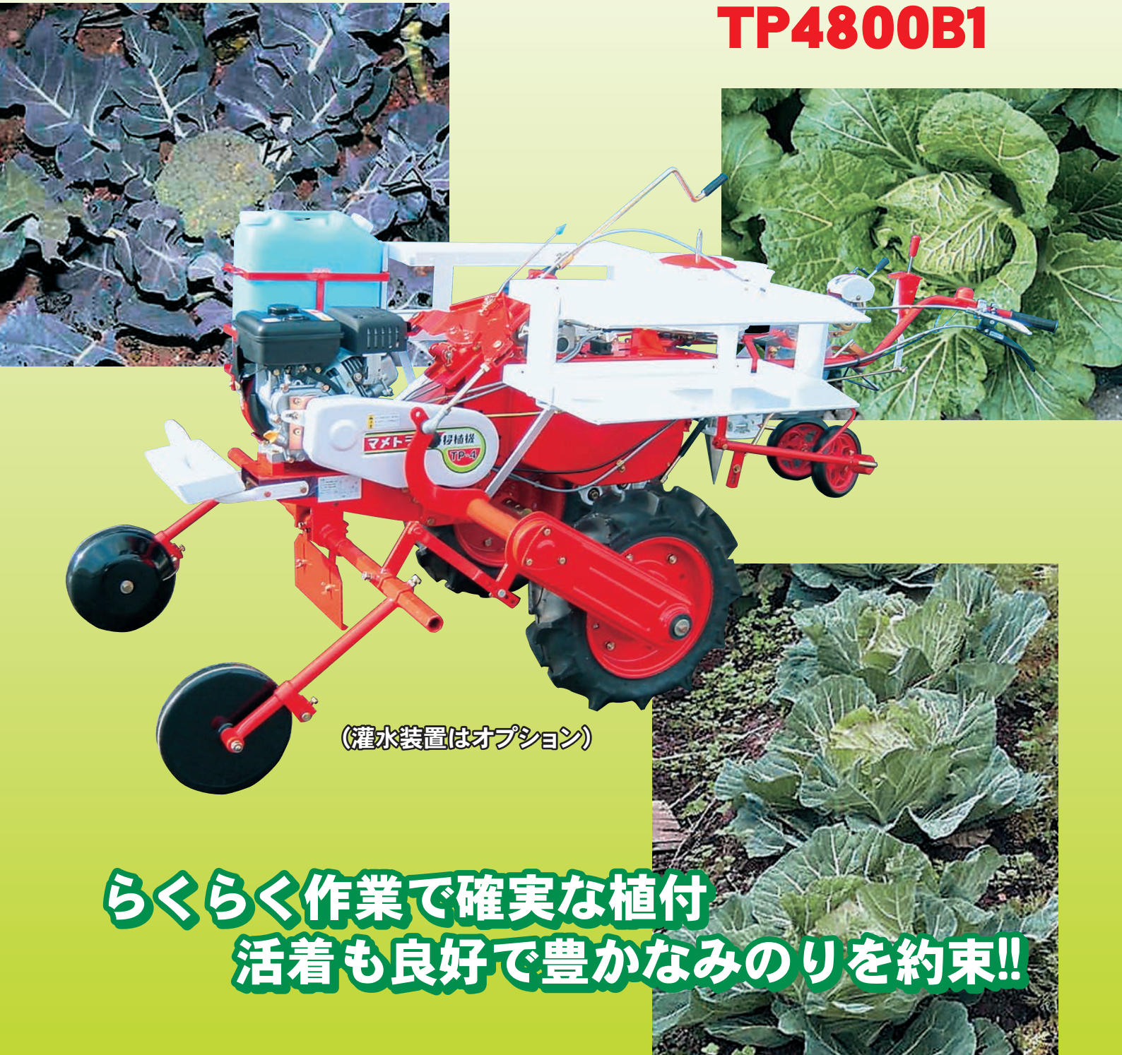
(灌水装置はオプション)